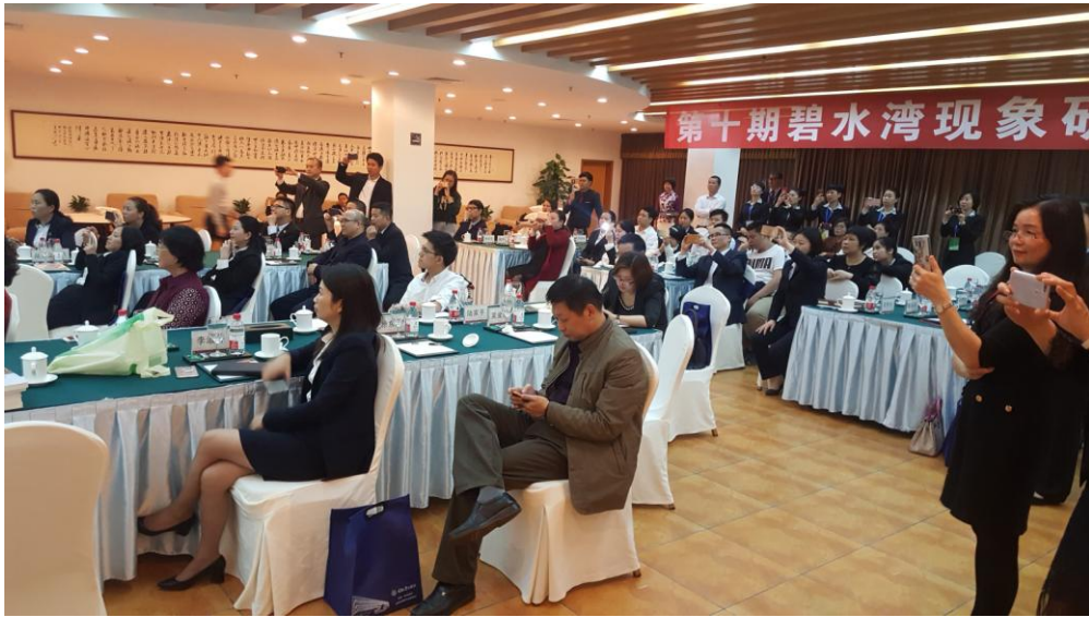
研讨会现场：不想错过任何精彩环节