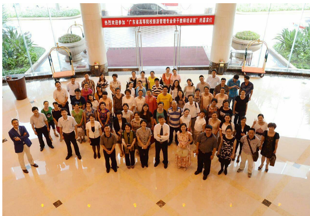
广东省高等院校旅游管理专业骨干教师培训班暨第一期“碧水湾现象研讨会”