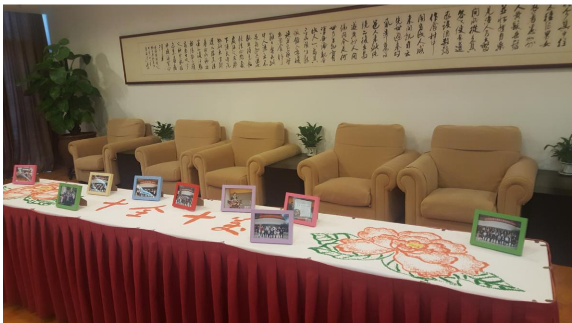
“十全十美”是碧水湾员工对第十期碧水湾现象研讨会的期盼，也是刘伟教授对前 10 期碧水湾研讨会的总结！