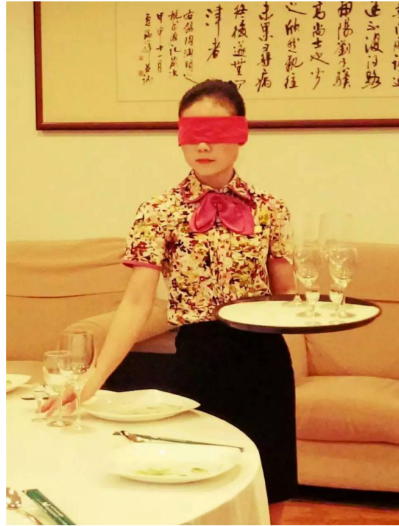
碧水湾员工绝活：蒙眼摆台