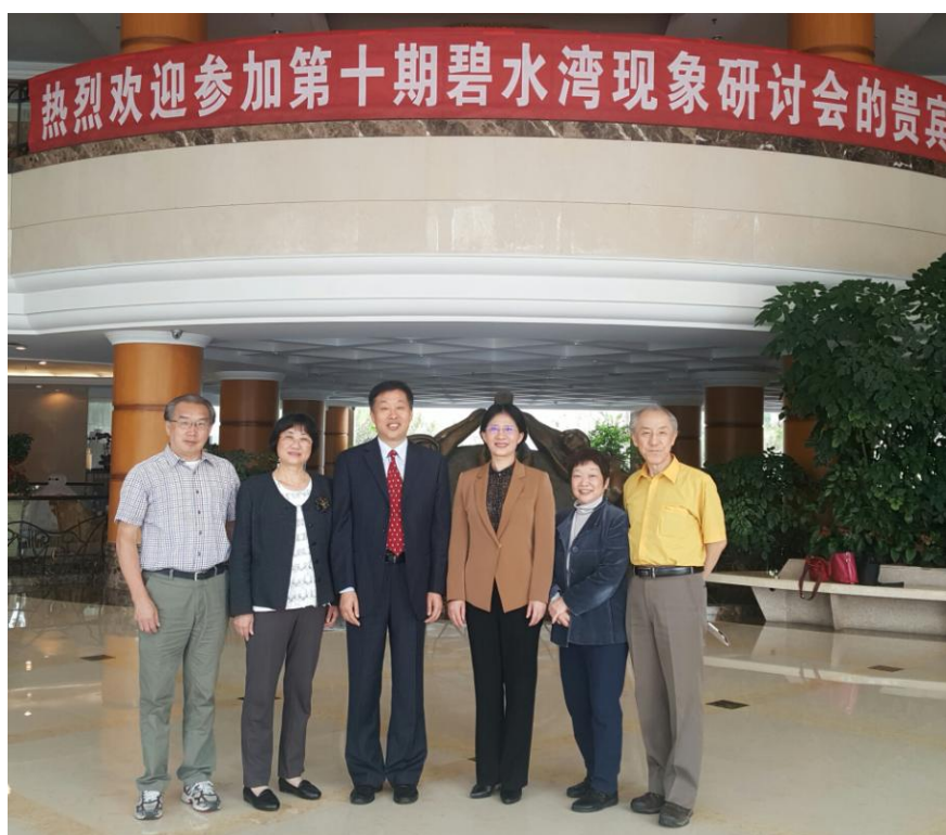
日本温泉管理专家、日本东洋大学梁春香教授以及早稻田大学川口教授一行的到来，使得本次研讨会成为一次“碧水湾现象“国际研讨会