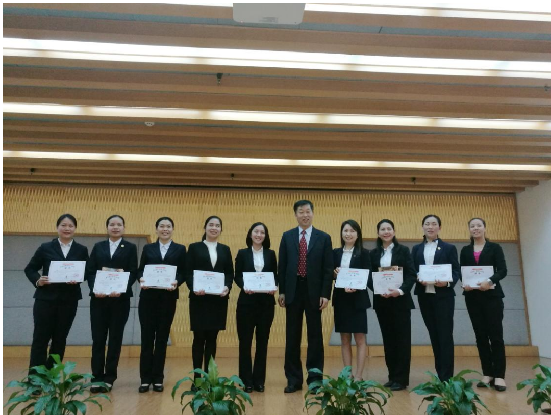
亨来斯登酒店派来近 20 人的管理团队前来学习