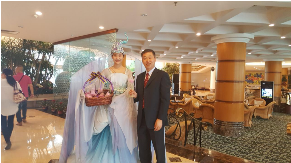
碧水湾“水仙子”在度假村大堂迎宾