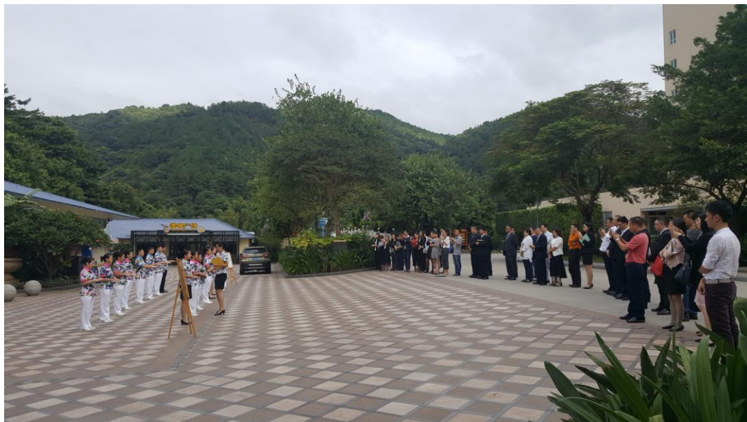
学员们在观摩碧水湾员工的班前培训