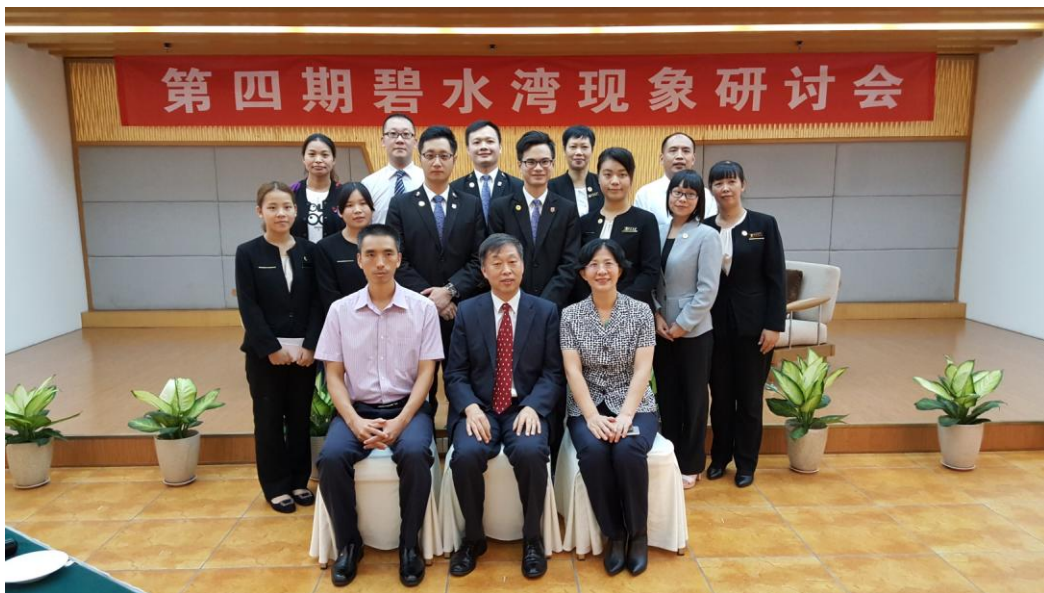
广东御景酒店第二批学习团队与度假村领导合影