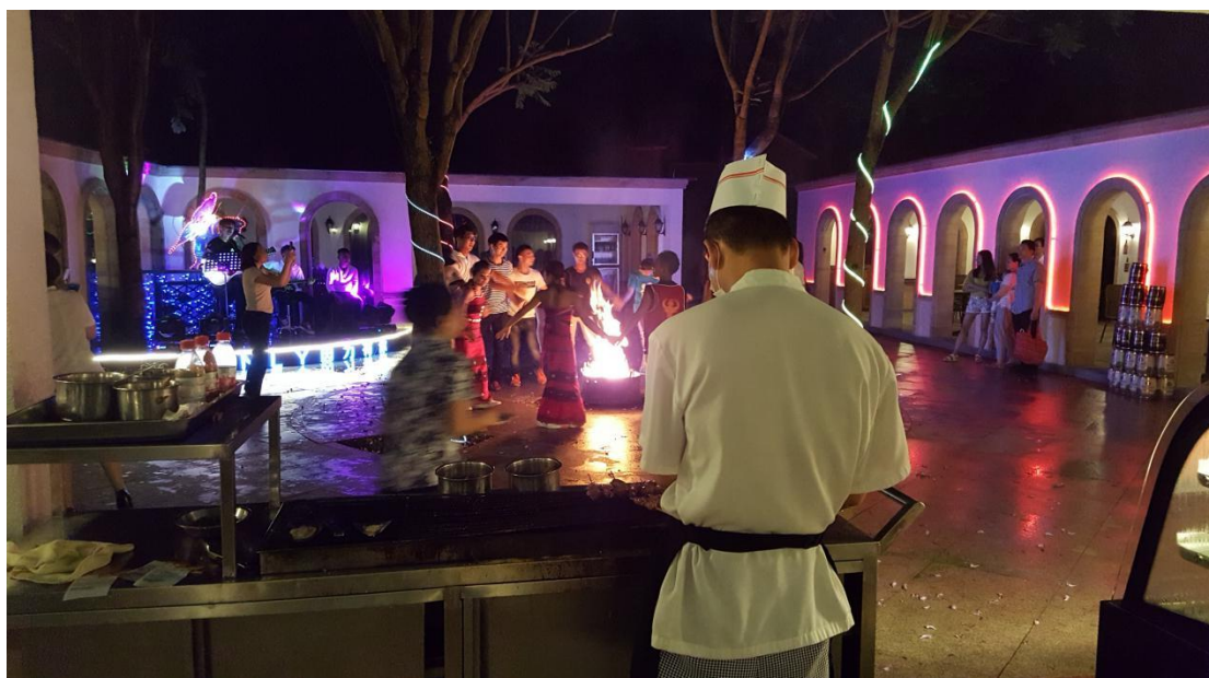
碧水湾音乐篝火晚会，给了学员们彻底放松度假的感受。。。。