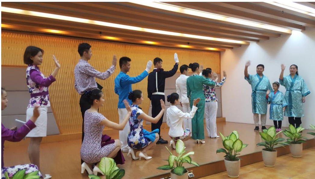
规范的服务+一颗真诚的心=优质服务 (碧水湾 80%以上的客人都是回头客)