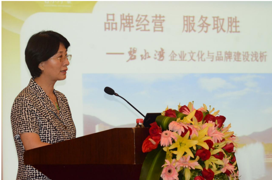
碧水湾董事长为大家介绍和深入分析碧水湾独特的企业文化及其品牌建设