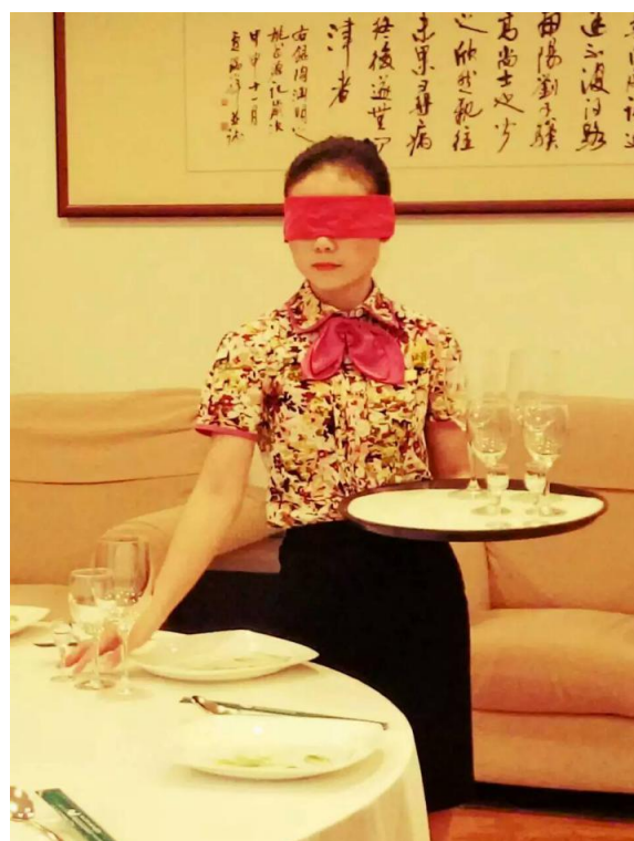
碧水湾员工绝活：蒙眼摆台