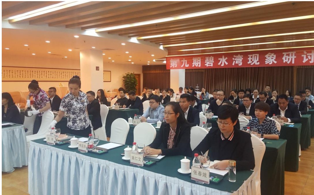
参加第九期碧水湾现象研讨会的学员们在认真听讲