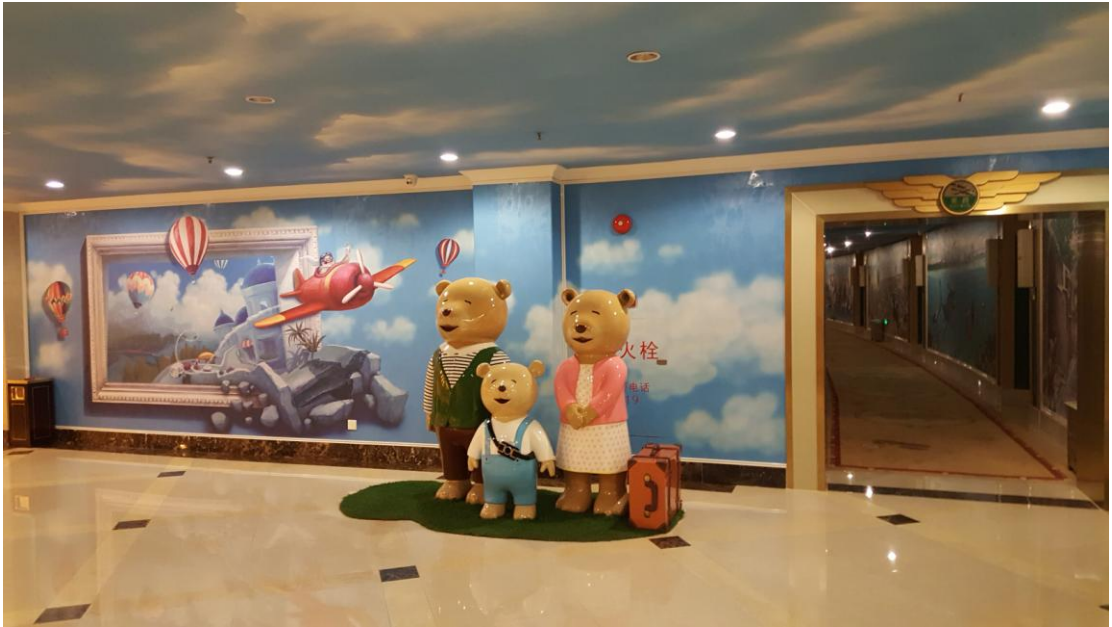
创新不断：碧水湾亲子客房欢迎你！