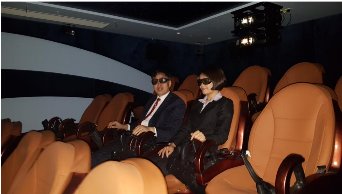
8D影院：碧水湾又有新产品！