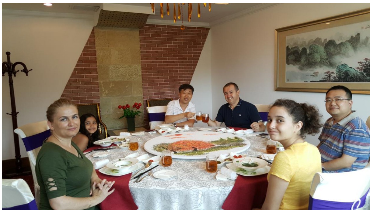
美国专家来碧水湾考察，对碧水湾的服务和管理赞不绝口，表示“再也不想离开碧水湾！”