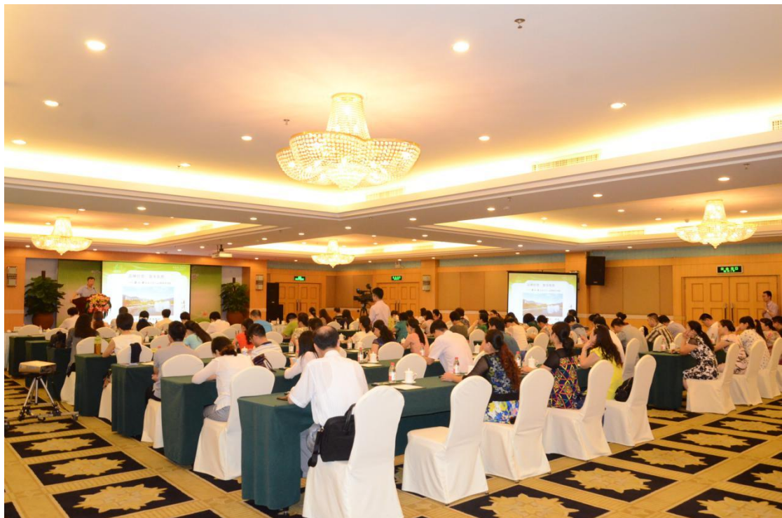
学员认真听讲记录点滴