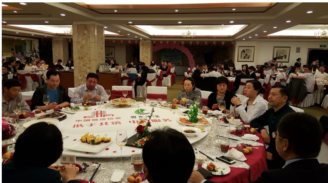
畅谈学习心得，两个字：震撼！