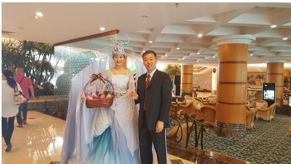
碧水湾“水仙子”在度假村大堂迎宾