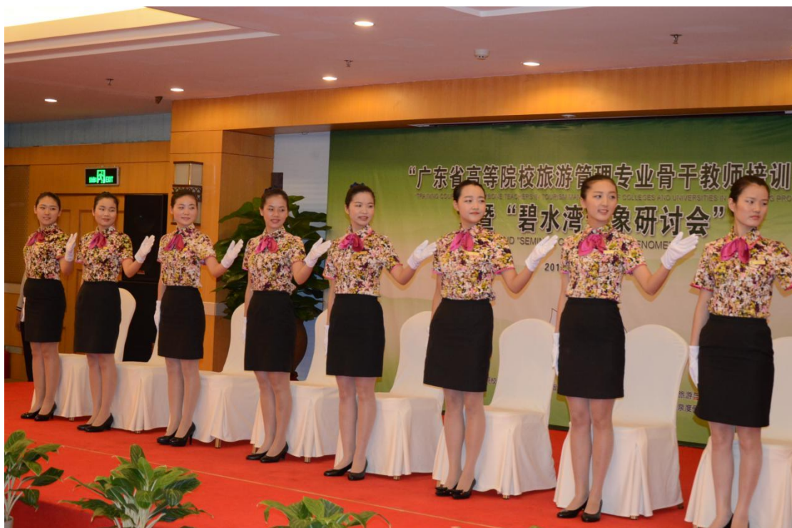
发自内心的微笑服务是由优秀的“企业文化+严格的培训”共同打造的