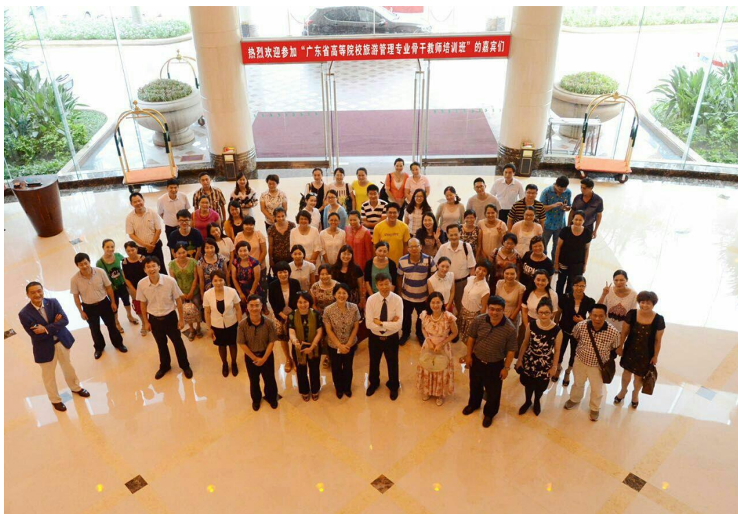
广东省高等院校旅游管理专业骨干教师培训班暨第一期“碧水湾现象研讨会”